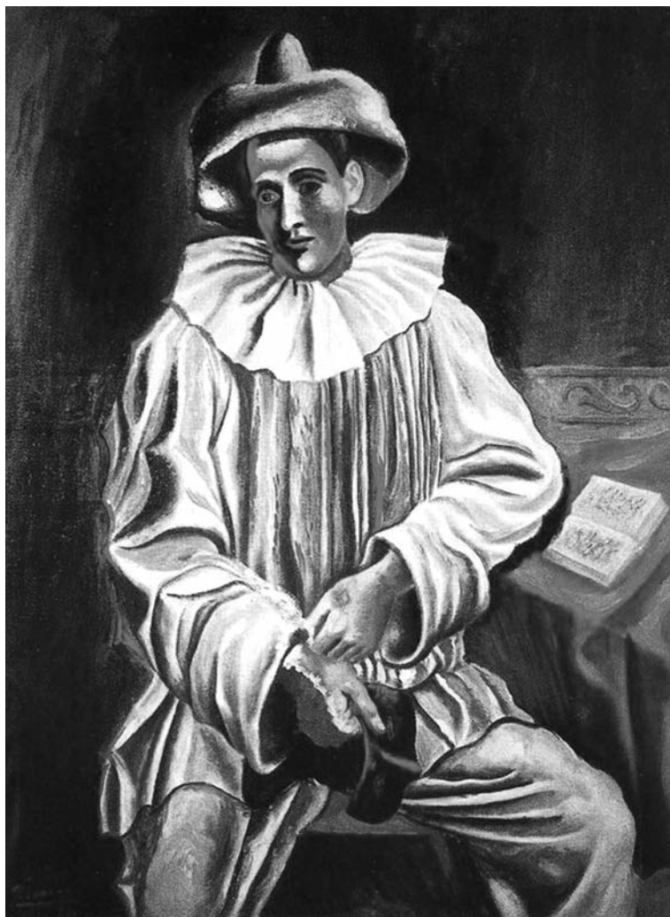
«Пьеро с маской», 1918. Художник Пабло Пикассо .