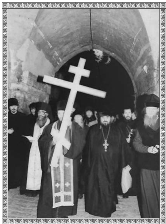
Паломничество на Святую Землю, Иерусалим, 1996 г.